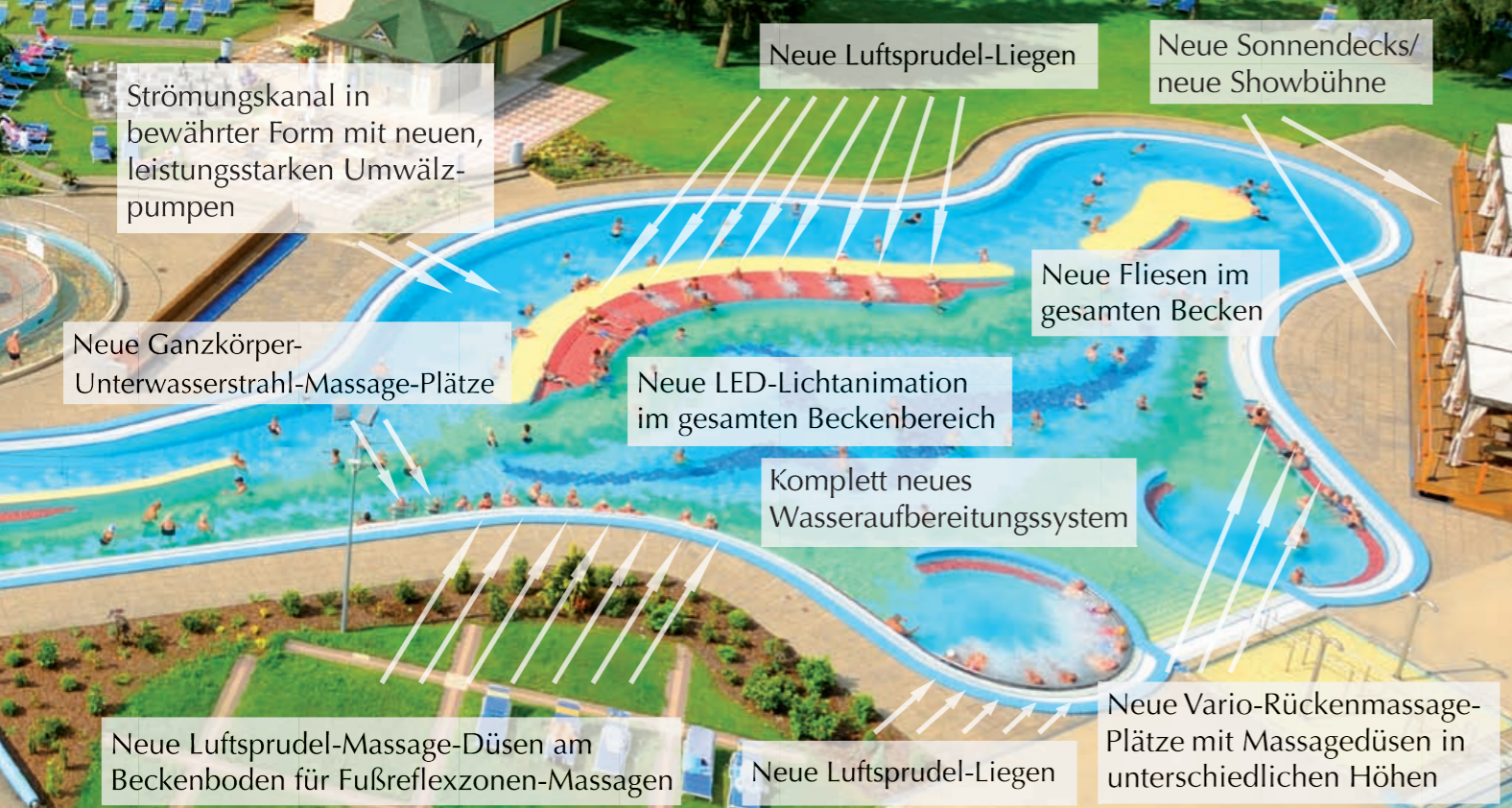
Das neue Strömungsmassagebad der Johannesbad Therme erleben