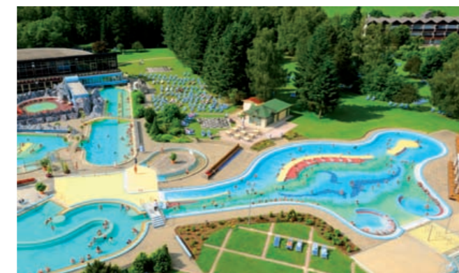
Erleben Sie das Johannesbad - Bad Füssings größte Therme mit 4.500 qm Wasserfläche, 13 Becken, 5 Saunen & Heilquelle